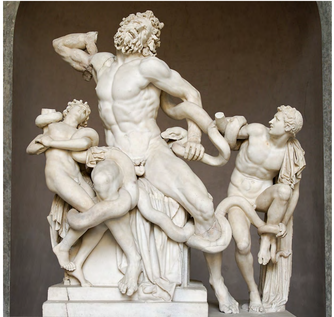
Laocöon et ses fils