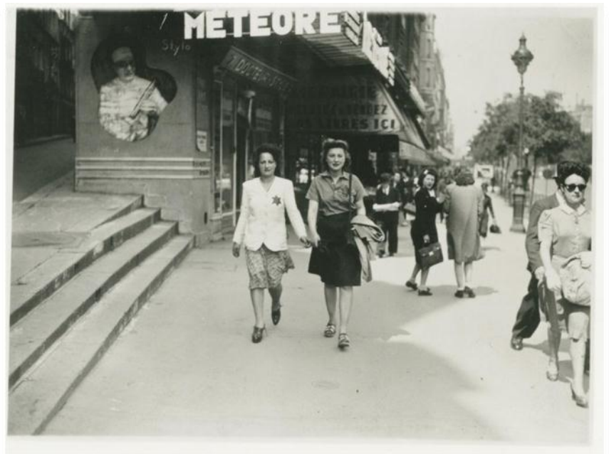
Jeunes femmes sur les grands Boulevards. Paris, juin 1942.