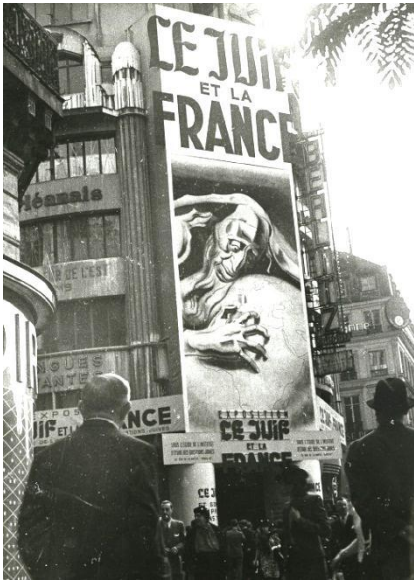
Façade du Palais Berlitz recouverte de l'affiche de l'exposition antisémite « Le Juif et la France », Paris 2ème arrondissement. France, 1941 © Mémorial de la Shoah/CDJC.