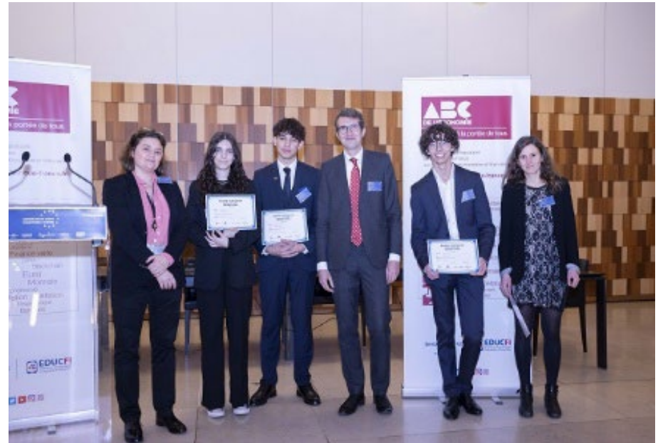
Finale française de l'édition 2022-2023

Semaine de l'Éducation Financière – Mars 2024