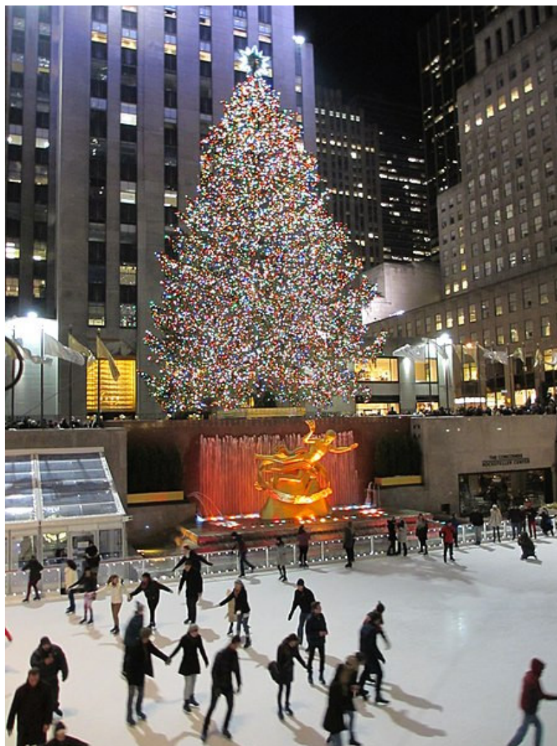
The Lower Plaza, Rockefeller Center, NYC

Si vous avez des difficultés à visualiser cet e-mail, suivez ce lien