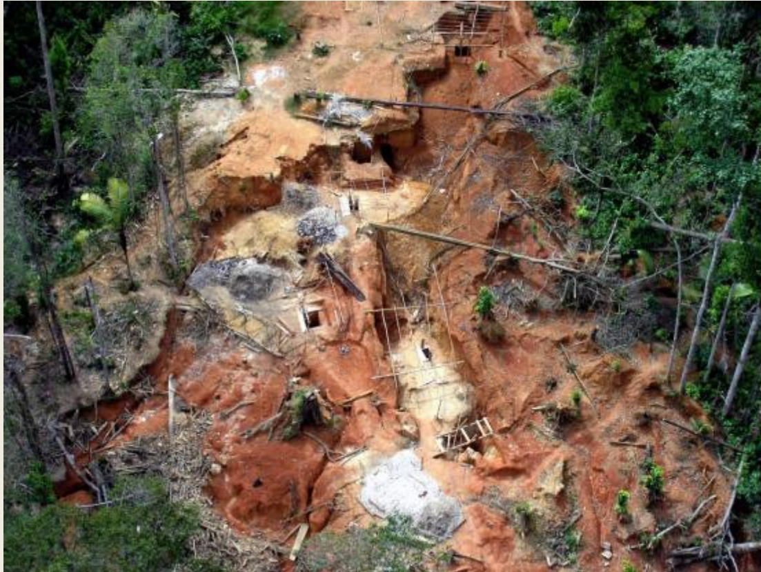
Photo de l'armée française montrant une mine d'or exploitée illégalement en Guyane, en 2012. AP/GILLES GESQUIERE