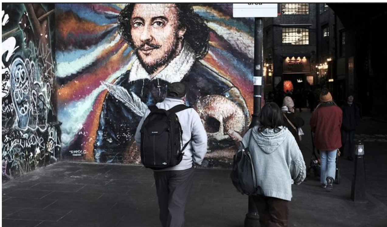
Shakespeare wall, South Bank, London, Jan. 2024

Si vous avez des difficultés à visualiser cet e-mail, suivez ce lien