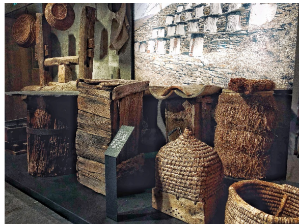
Ruches en terre cuite, habillage de paille

Cette forme de ruche est particulièrement adaptée à la forme de l'essaim dans son habitat naturel. Elle répond à des contraintes de solidité et de résistance (la forme ovoïde peut être assimilée à celle de l'assemblage de deux voûtes), de thermodynamique (elle a une très bonne qualité d'isolation et permet de maintenir la température), de fonctionnement biologique de qualité (elle garantit une bonne hygiène et une bonne circulation de l'air, la terre cuite, poreuse, permettant les échanges gazeux entre intérieur et extérieur et ne se décomposant pas puisqu'elle est purement minérale. Il n'y a ni moisissures, ni larves, ni nuisibles qui s'y infiltrent). Elle permet également d'assurer une vie sociale, de protéger la procréation de l'espèce en défendant au mieux l'essaim face aux agressions extérieures.