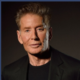
Interview avec Calvin Klein

N'hésitez pas à me partager vos sentiments et ressources!