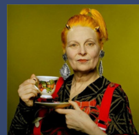
Interview avec Vivienne Westwood