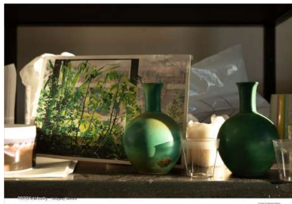
Wolfgang Tillmans, still life (Bühnenbild) , 2020. Projet Between Bridges

Par les problématiques abordées et les concepts développés cette thématique s'adresse plutôt aux élèves à partir du cycle 3, collège, lycée.