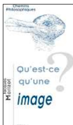
IMAGE du latin imago « représentation, imitation, portrait - sous forme de statue, de peinture... Représentation par la pensée, évocation; vision, songe .»

Jacques MORIZOT, Qu'est-ce qu'une image ? , 2005, Vrin, Paris, p. 7-8.