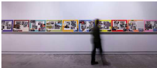
Clemens von WEDEMEYER, Images and Network (crowds and power) , 2018, photographie, 16 tirages jet d'encre collés sur Forex,

EN LIEN AVEC | LES ARTS PLASTIQUES | LA PHILOSOPHIE | L'ÉDUCATION À L'IMAGE