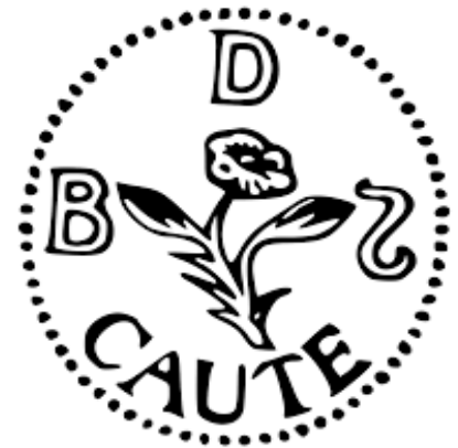
La devise de Spinoza, inscrite sur son sceau : « Prends garde ».