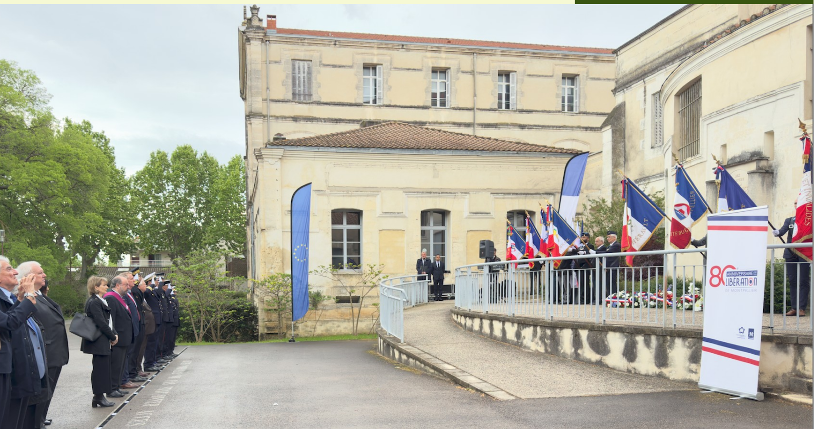
Cérémonie à la cité scolaire Françoise Combes à l'occasion de la Journée nationale du souvenir des victimes de la déportation"