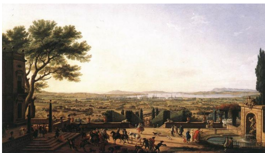
Joseph VERNET (1714-1789), La ville et la rade de Toulon, deuxième vue, le port de Toulon, vue du mont Faron, 1756 , Huile sur toile, H. : 165 cm, L. : 263 cm, Paris, musée du Louvre ;