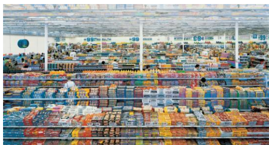
Andreas GURSKY (1955-), 99 Cent, 1999 , Tirage : 5/6, photographie, épreuve couleur sous Diassec, épreuve chromogène, 206,5 x 337 x 5,8 cm (197 x 327 cm hors marge), Paris, Musée national d'art moderne (MNAM).