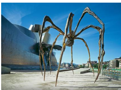
Louise BOURGEOIS (1911-2010), Maman, 1999 (fonte de 2001) , Bronze, marbre et acier inoxydable, 8,95 x 9,80 x 11,6 m, édition 2/6. Bilbao, musée Guggenheim Bilbao, Espagne. https://www.guggenheim-bilbao.eus/fr/la-collection/oeuvres/maman