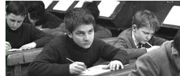
Les 400 coups, Truffaut, 1959

Nous occuper étroitement des productions écrites des élèves ne doit pas nous faire oublier de regarder aussi de près ce qui se passe à l'oral autour de ces écrits. L'écrit d'apprentissage , caractéristique des situations scolaires, est en effet un écrit accompagné et suivi de beaucoup d'interactions orales , fortement tissées avec les passages à l'écriture tantôt individuels, tantôt collectif