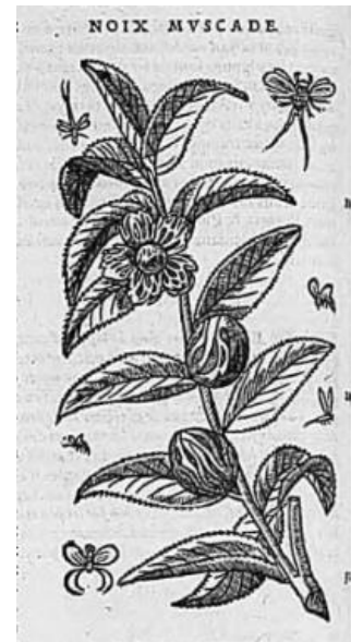
Illustration de P. A. Mattioli, médecin siennois, 1572, BNF

Giles Milton, La guerre de la noix de muscade , éd. Noir sur Blanc, 2001