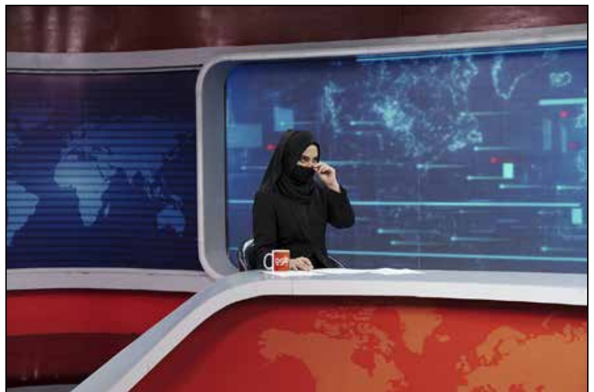
© Sandra Calligaro / item Lauréate 2024 du Prix Françoise Demulder