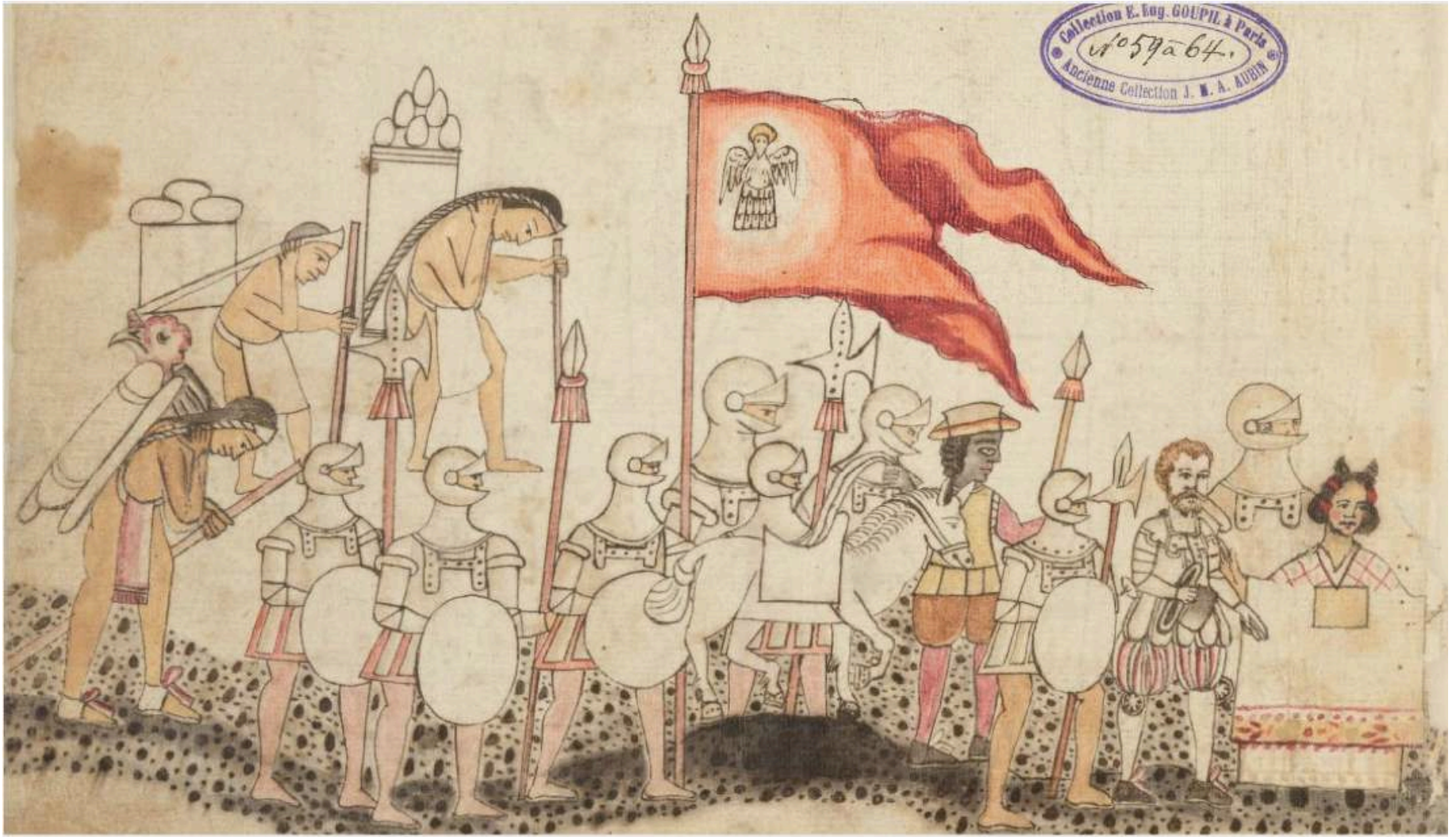
Codex Azcatitlan, Paris, BNF