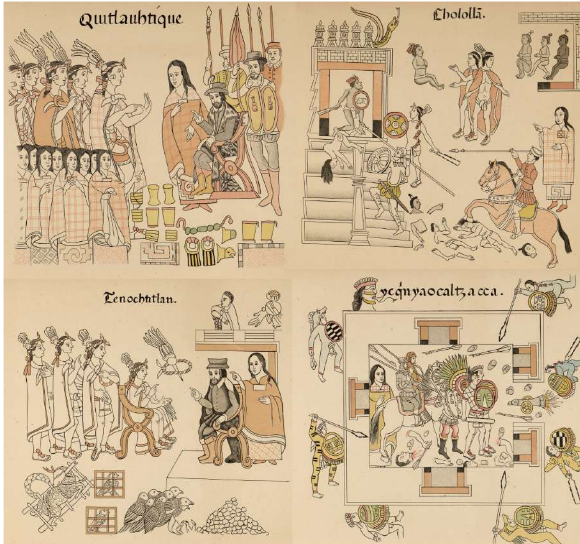
Lienzo de Tlaxcala, fin 16e siècle