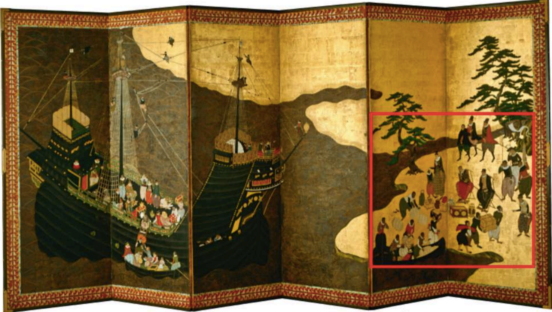
Extrait du manuel Nathan 5 ème , sous la direction d'Anne-Marie Hazard-Tourillon et de Sébastien Cote, 2016, version numérique, document interactif, p. 132.