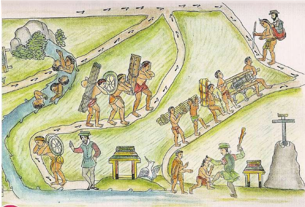
Codex Lienzo de Tlaxcala, 1550.

Extrait du manuel Bordas, 5 ème , ss la dir. De R. Cartigny, 2016