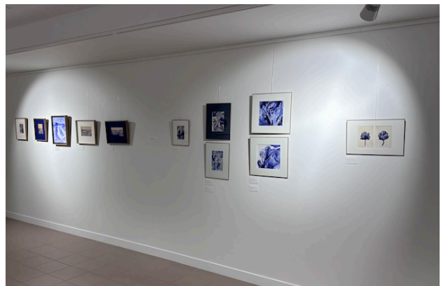
Vues de l'exposition

Quinze classes des sections générales et professionnelles ont bénéficié d'interventions de l'artiste. En anglais, français, commerce, arts plastiques ou encore enseignement scientifique, les groupes ont pu axer leurs recherches sur la poésie de l'image, le marché de l'art, le protocole et la représentation du paysage mais aussi répertorier le végétal du lycée dans des herbiers graphiques.