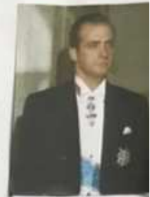
Juan Carlos I