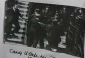
Coup d'état du 23 février 1981