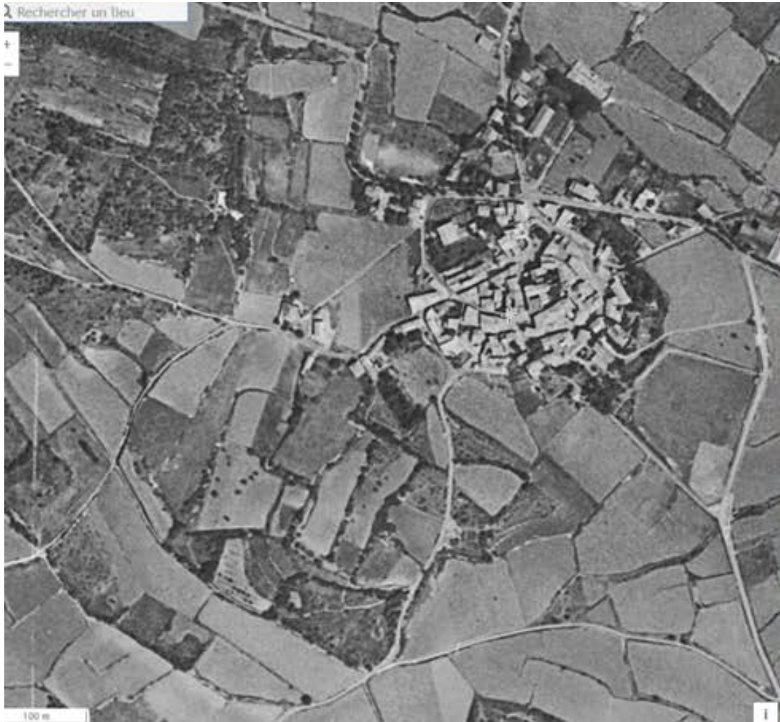
Photo aérienne de Murviel aujourd'hui