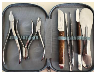
Figure 1 : exemple d'une trousse amovible