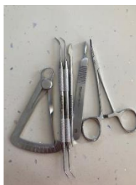
Figure 2 : exemple d'une trousse fixe