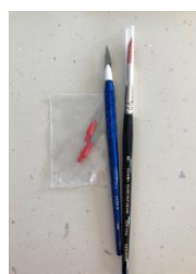
Figure 3 : exemple de trousse à céramique