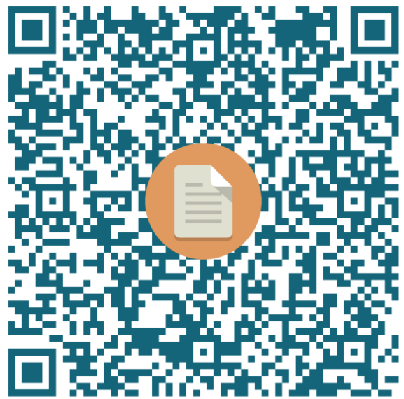
QR code d'accès au pearltrees

Pearltrees de l'équipe Ressources Lettres Montpellier