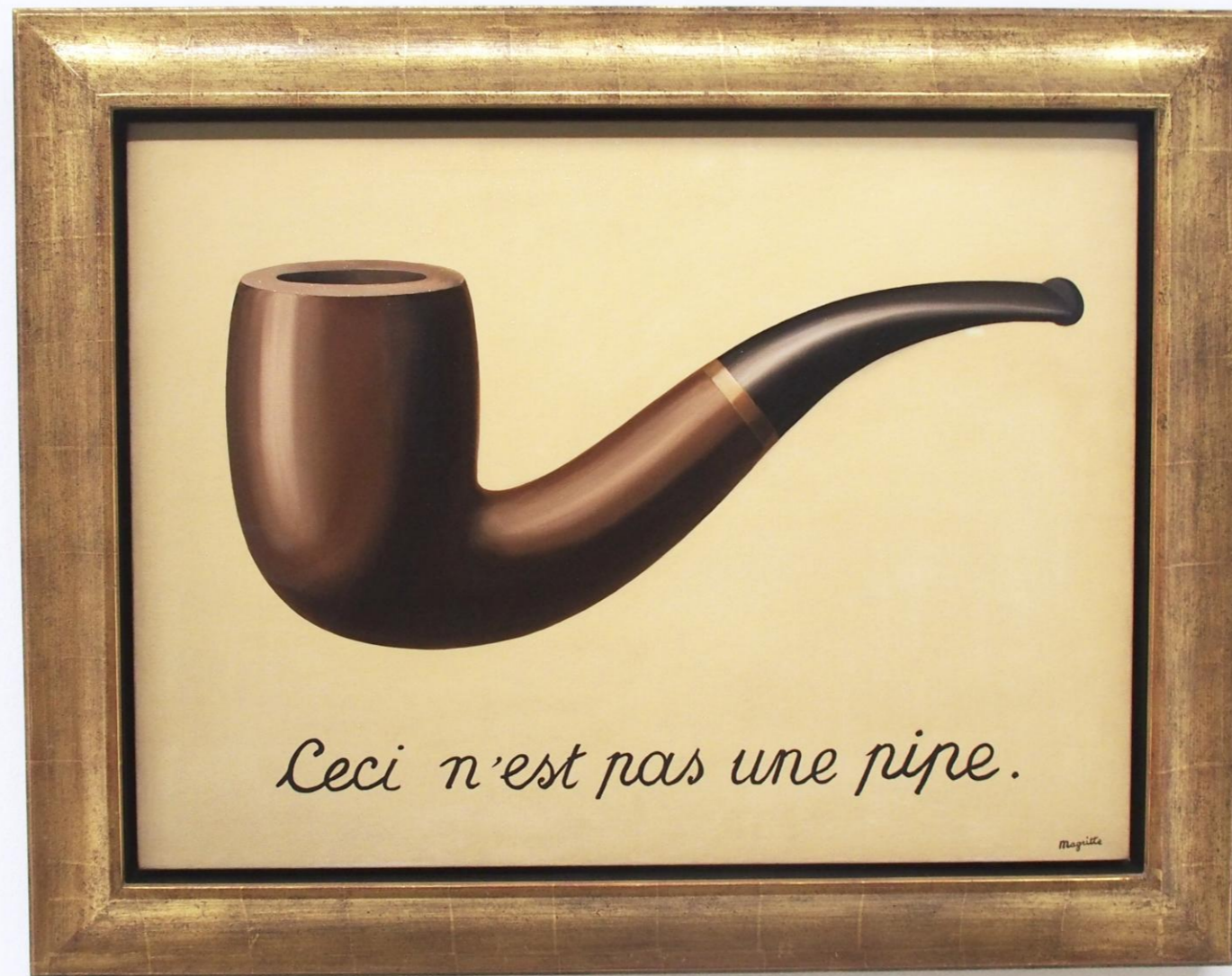
La Trahison des images (Ceci n'est pas une pipe), 1929