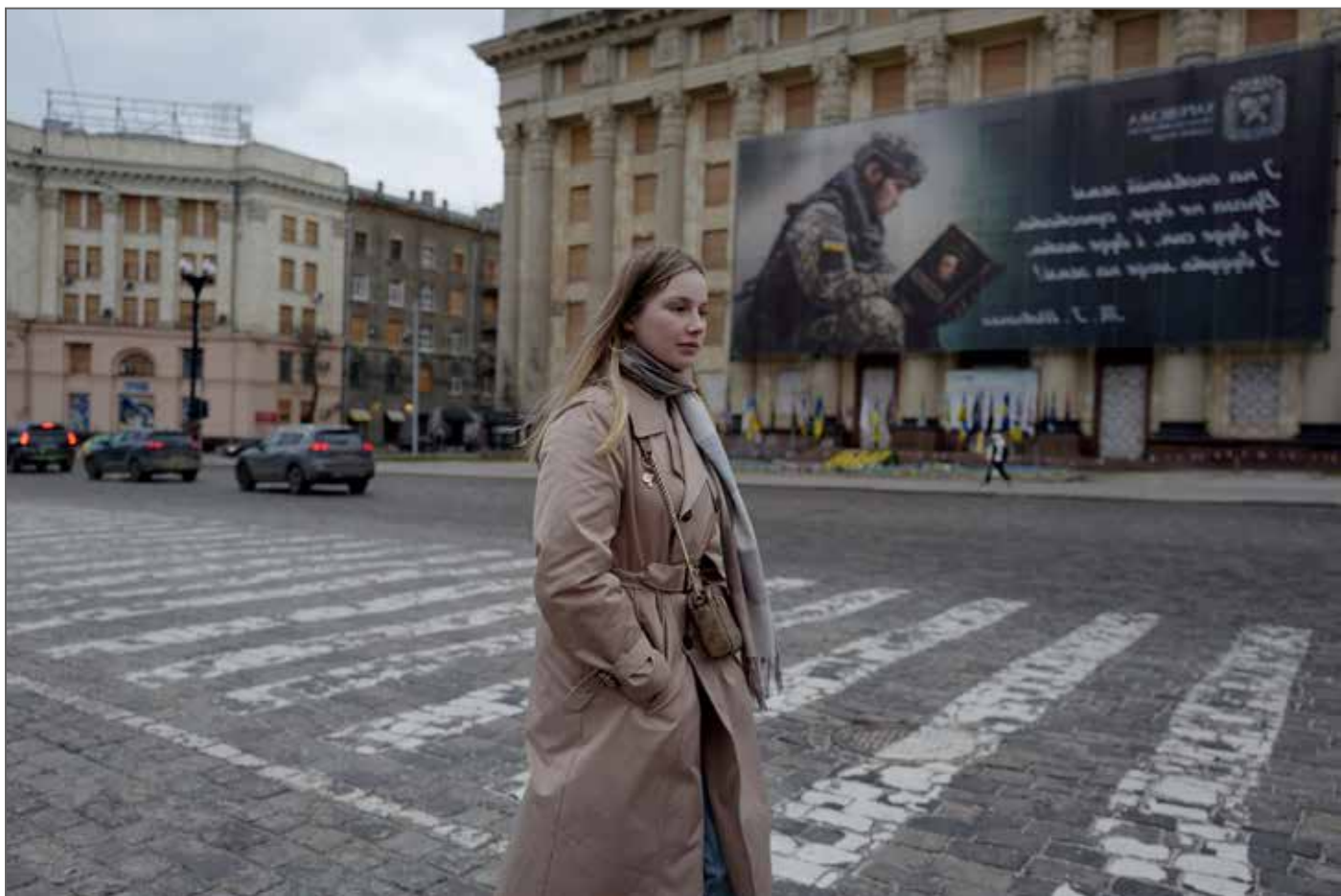
© Marion Péhée - Lauréate 2025 de la Bourse Canon de la Femme Photojournaliste