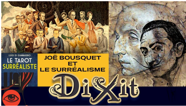
Un jeu de DIXIT surréaliste