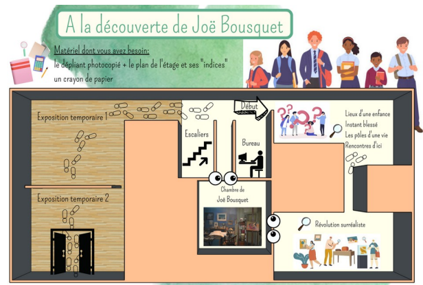
Un jeu d'énigmes type « escape game »