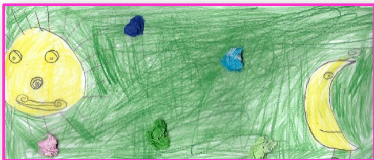
Léo Toulemonde, CE1 École La Suberaie Le Boulou / El Voló