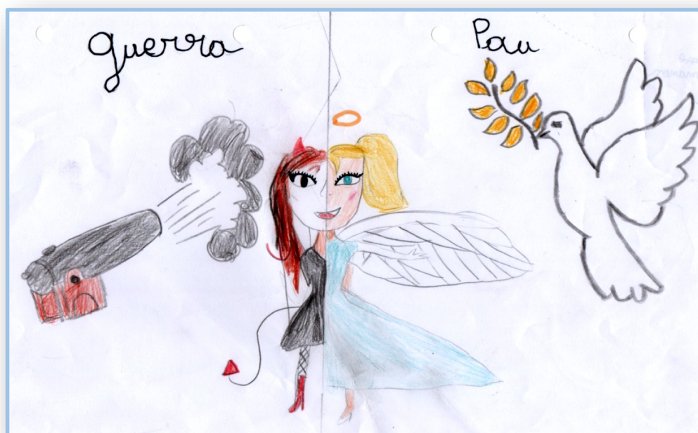
Illustration : Manon Notebaert, CM2, École Pons Rivesaltes / Ribesaltes

Téo Lepetz, CM1 École Pons Rivesaltes / Ribesaltes