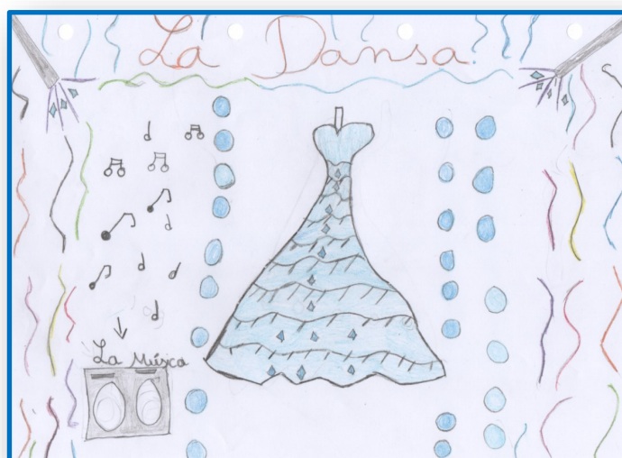
Illustration : Sara Haitoff, CM2 École Pons Rivesaltes / Ribesaltes

Marion Pelletant, CM2 École Pons Rivesaltes / Ribesaltes