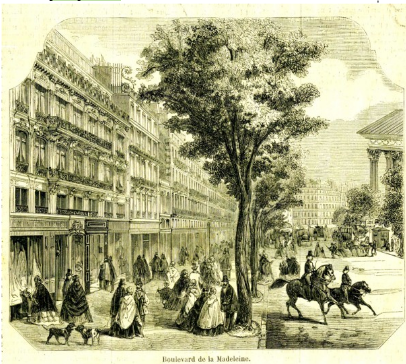
Boulevard de la Madeleine.

Cependant, il est important aussi de parler de l'île de la Cité à mon sens car elle a été complètement raser pour laisser place à ces nouvelles infrastructures. Maintenant, elle comporte la Place de la Madeleine, la préfecture de la Police , le Tribunal de Commerce, l'Hôtel-Dieu ,Notre-Dame, Quai aux Fleurs, la Morgue et l'Etat-Major des sapeurs-pompiers.