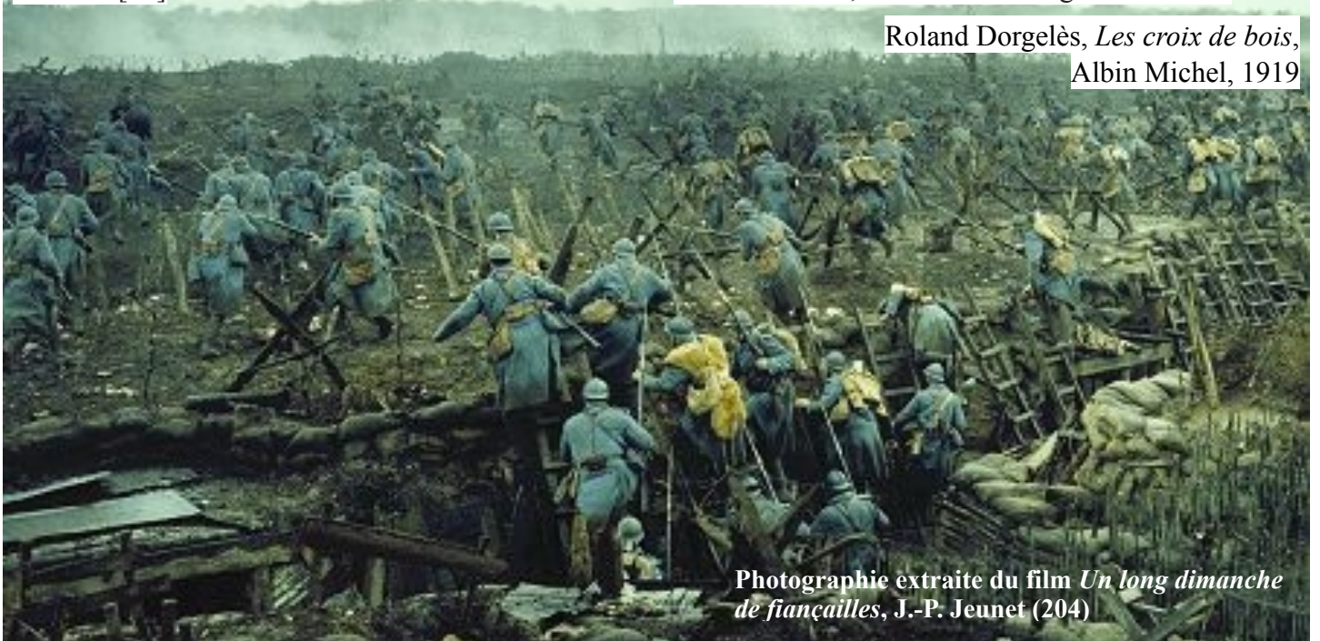
Photographie extraite du film Un long dimanche de fiançailles , J.-P. Jeunet (2004)