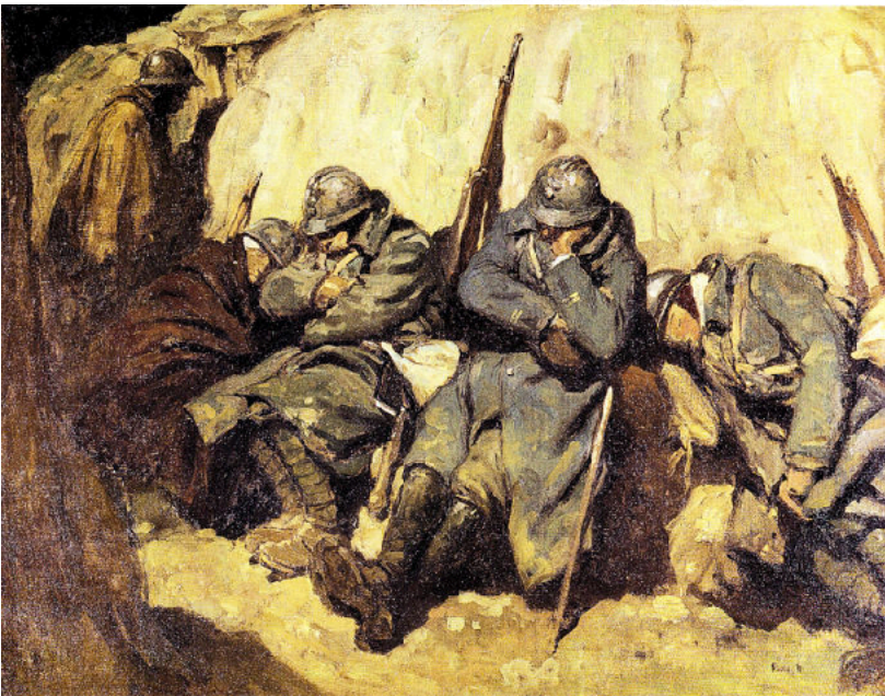
Une tranchée, peinture de Georges Scott http://www.dessins1418.fr/wordpress/portfolio/georges-scott-une-tranchee/#prettyPhoto

Source gallica.bnf.fr / Bibliothèque nationale de France