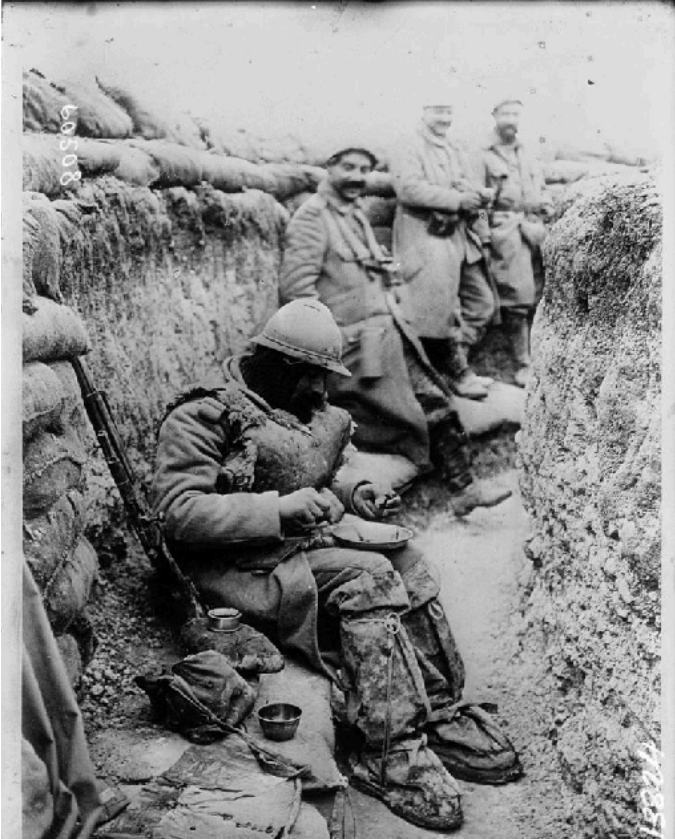
Dans la tranchée, la soupe : [photographie de presse] / Agence Meurisse - 1916 http://gallica.bnf.fr/ark:/12148/btv1b9044614r

Source gallica.bnf.fr / Bibliothèque nationale de France