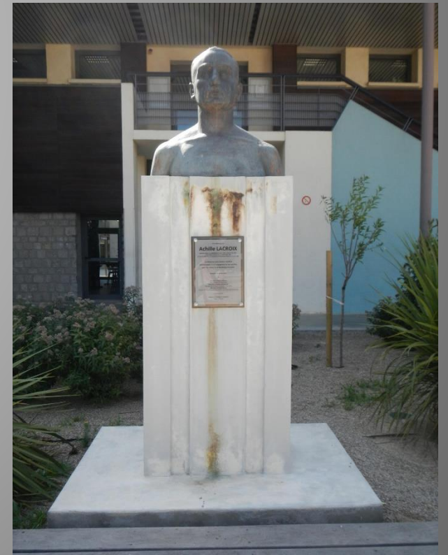
Buste d'Achille Lacroix Lycée Docteur Lacroix Narbonne