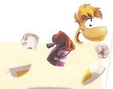
Rayman, personnage créé par Ubisoft.