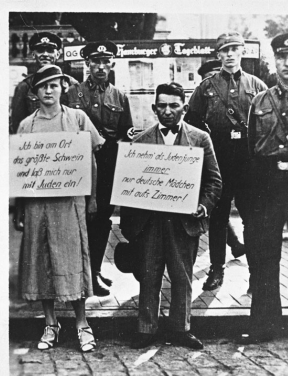
Diese Beiden wurden im Sommer 1935 aus einem Hamburger Hotel herausgeholt und heringeführt.