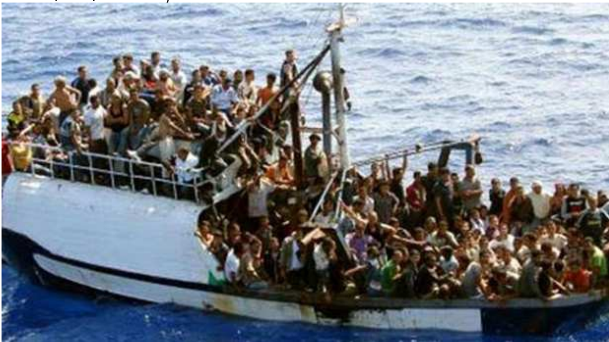
Image publiée le 25 septembre 2008 par la Marine française, avec une légende indiquant « Un bateau de pêche transportant 300 migrants illégaux en mer Méditerranée avant son interception le 24 septembre par un navire militaire français qui patrouillait pour Frontex, l'agence européenne chargée de la sécurité aux frontières. La Marine française a remis les migrants aux autorités italiennes sur l'île de Lampedusa » site de l'AFP

Photographie scannée, tirée de l'Hors-Série l'Histoire intitulé « L'odyssée des réfugiés » n°73 Légende de la photographie : « migrants à bord d'une embarcation interceptée au nord des côtes libyennes par la marine italienne en juin 2014 » (AKG. Massimo Sestini/EPA/MAXPPP)