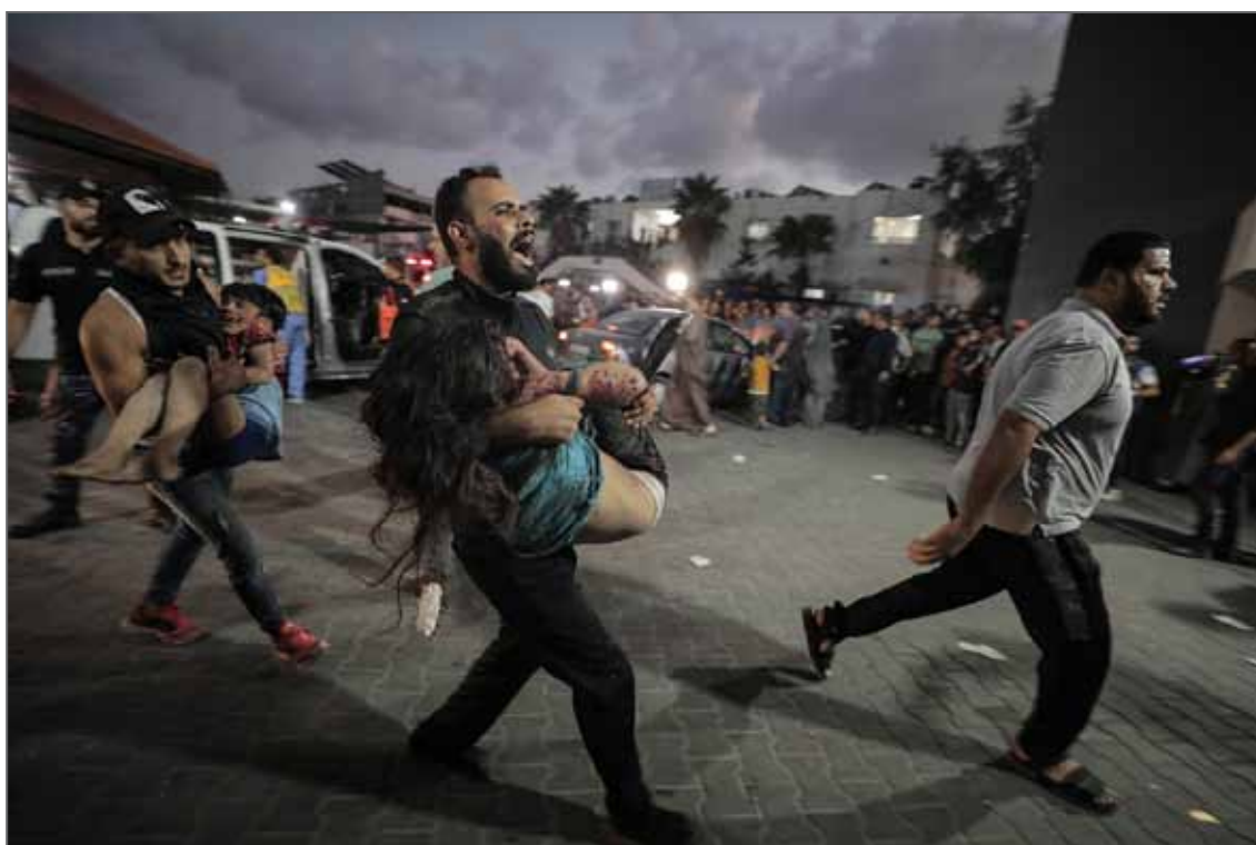
© Loay Ayyoub pour The Washington Post Lauréat du Visa d'or de la Ville de Perpignan Rémi Ochlik 2024

Durant cinq mois, depuis les premières heures qui ont suivi l'attaque sans précédent du Hamas contre Israël le 7 octobre 2023 jusqu'en février 2024, Loay Ayyoub a photographié la guerre à Gaza pour The Washington Post , couvrant l'un des conflits les plus dévastateurs du XXI e siècle, qui a causé la mort de plusieurs dizaines de milliers de personnes, provoqué le plus grand déplacement dans la région depuis la création d'Israël en 1948, et fait sombrer plus de la moitié de la population dans la famine.