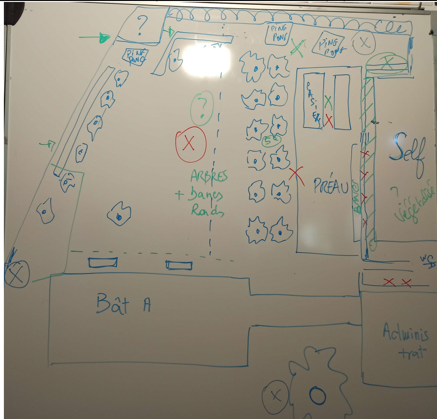
Schéma de la cour avec les espaces utilisés, non utilisés et qui pourrait être utilisés

Voici le schéma de synthèse de ce travail :