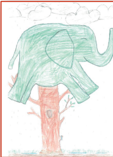
Illustration : Jade Llobet, CM2, Ecole Louis Pasteur, Ille-sur-Têt / Illa

Illustration : Léo-Paul Épailly, CM2, Ecole Louis Pasteur, Ille-sur-Têt / Illa